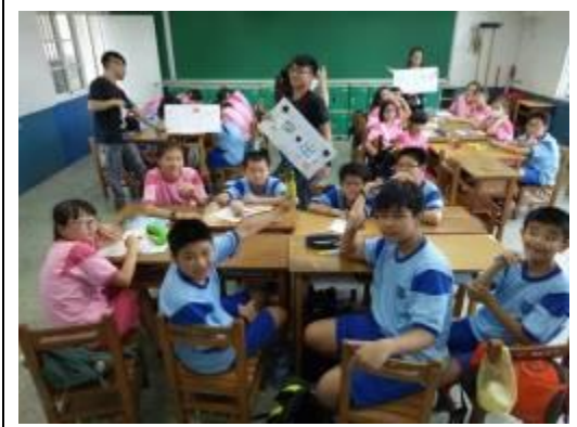
學生進行課程活動「手繪安平鎮」