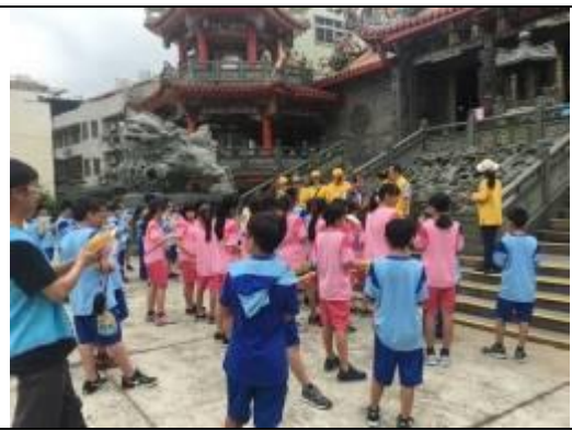
學生進行課程活動「走讀安平鎮」