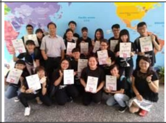
校長頒發感謝狀給辛苦的講師