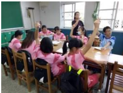
「歡樂安平鎮」反思活動