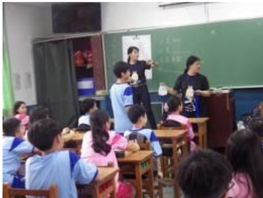
學生進行課程活動「細說平鎮」