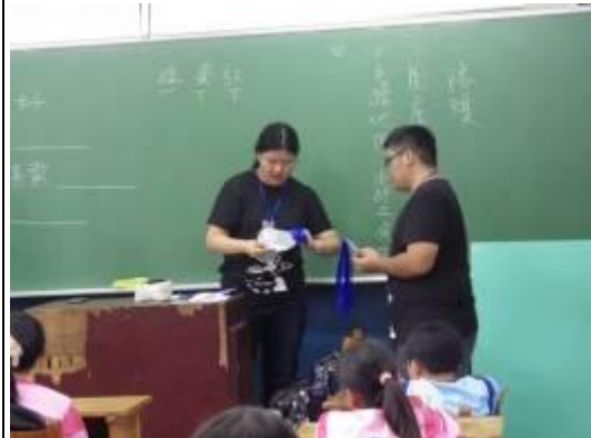
課程簡介，認識課程